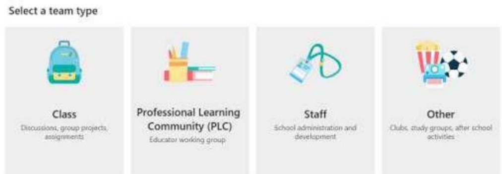
Gambar 3. Tampilan pilihan kelas Microsoft Teams