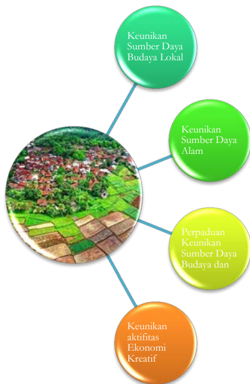
Gambar: Karakteristik Desa Wisata

Dalam konteks desa wisata, desa wisata didasarkan pada potensi daerah pedesaan dengan keunikan dan pesona pedesaan. dapat dikatakan sebagai aset pariwisata, yang dapat dimajukan dan dikembangkan sebagai produk wisata yang menarik wisatawan ke desa tersebut. Pada dasarnya jenis-jenis desa wisata dapat diklasifikasikan ke dalam empat kategori berikut sesuai dengan karakteristik sumber daya dan keunikannya sebagai berikut: