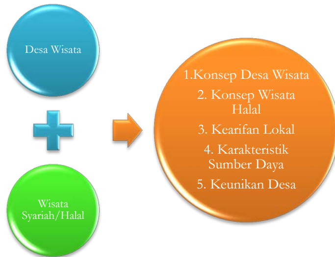
Gambar: Integrasi Desa Wisata dengan Wisata Halal

Dalam proses pengelolaan desa wisata halal, masyarakat desa memiliki peranan yang sangat signifikan. Pada kajian Desa Wisata Halal ini memunculkan pandangan baru yang erat kaitannya dengan hubungan manusia dan masyarakat, manusia dan alam serta manusia dan tuhan. Adapun, alasan-alasannya sebagai berikut: