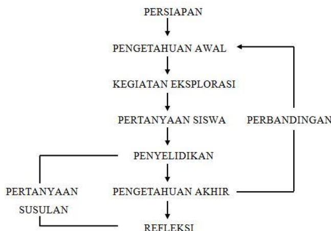
Gambar. Tahapan model pembelajaran interaktif

Pada tahap persiapan dosen pengampu menyiapkan sebuah SAP dan Silabus makul filsafat dan pemikiran pendidikan islam yang di bina oleh Dr. Mohammad Hasan, M.Ag. dengan membebaskan mahasiswa memilih topic pembahasan tersendiri dan juga dapat menentukan patner kelompok sesuai dengan keinginan mahasiswa, hal ini menunjukkan bahwa IAIN Madura telah menerapkan kurikulum MBKM. 8