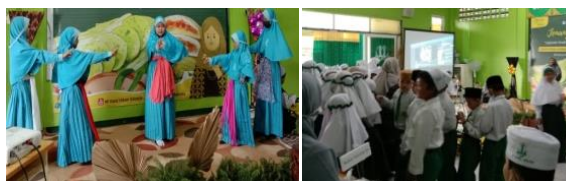
Gambar 3. Pentas Perwakilan Acara Kidzpreneur MI Darul Hikam Waru

Pelaksanaan kidzpreneur dimulai pukul 07.00 WIB. Antar siswa dalam kelompok bekerjasama mempersiapkan barang jualannya. Peran siswa dibagi menjadi 2 yaitu pembeli dan penjual. Bagi pembeli terdapat sesi menonton tayangan belajar bersama sesuai provinsi yang ditentukan dan menonton pertunjukkan tari dan nyanyian dari perwakilan kelas.