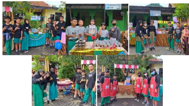
Gambar 2. Pelaksanaan Bazar Inovasi SD Negeri Pepe Sedati

Sebelum tahap ini dilakukan, siswa dalam kelompok melakukan persiapan bazar inovasi yaitu dengan menghias atau menata tempat/meja yang sudah disediakan. Kegiatan jual beli dari seluruh kelas VI bertempat di halaman sekolah pada jam istirahat I pukul 09.00-10.00 WIB. Dalam hal ini guru hanya mengawasi/mendampingi saja, serta dibantu dengan dukungan paguyuban wali siswa kelas VI SD Negeri Pepe Sedati. Berikut adalah pelaksanaan jual beli Bazar Inovasi Makanan dan Minuman: