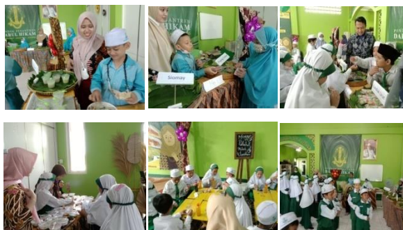
Gambar 4. Pelaksanaan Kidzpreneur di MI Darul Hikam Waru

Kegiatan jual beli siswa didampingi masing-masing guru kelas. Hal ini bertujuan untuk membimbing dan mendampingi siswa dalam menghitung uang kembalian.