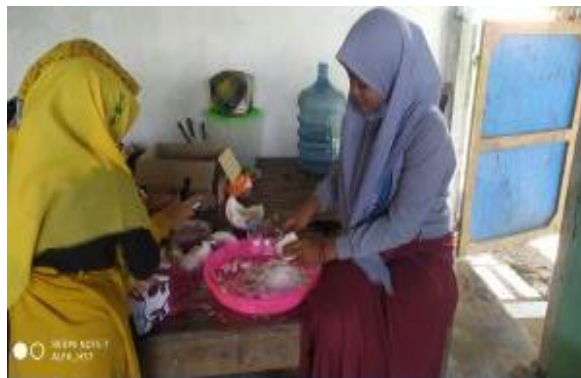
Proses perajangan kelapa dengan alat pelajang

Pelatihan pembuatan keripik kelapa oleh ibu-ibu PKK telah menumbuhkan rasa percaya diri di antara anggota. Bahkan ada sebaian