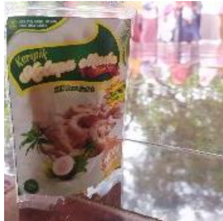
Gambar 5. Packing produk kripik kelapa Desa Sadah

Kebermanfaatn dari program kegiatan ini adalah untuk mengetahui bahwa adanya produk keripik kelapa tersebut dapat dijadikan sebagai upaya pemulihan ekonomi pasca bencana di desa Sadah. Semula buah kelapa yang tidak dimanfaatkan secara maksimal dan hanya dijadikan sebagai santan, tetapi sekarang bisa dijadikan olahan keripik kelapa yang salah satunya dapat meningkatkan pendapatan masyarakat desa Sadah.