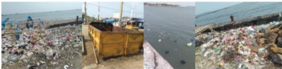
Gambar 1 lokasi pembuangan sampah di Kecamatan Labuan Pandegelang

mikro dilakukan dengan kolaborasi dengan pemangku adat setempat, masyarakat serta Pemerintah setempat. Kolaborasi ini bisa membuat aturan yang bisa menjadi tata tertib pengunjung dalam berwisata di laut. Sebab banyak studi mengatakan pelancong Indonesia kurang ramah terhadap lingkungan termasuk sering membuang sampah sembarangan. Sehingga, dengan memperketat tata tertib akan semakin membuat keasrian lokasi laut yang aman, nyaman dan lestari sebagai bagian dari kehidupan. Berikut ini adalah perbedaan lokasi wisata di Muna, Buton dan Pndegelang dalam pengelolaan sampah. Dari gambar tersebut terlihat bahwa suasana pantai di Muna dan Buton lebih baik dari Kabupaten Pandegelang. Sekalipun sudah disediakan tempat sampah namun masyarakat masih tetap membuang sampah sembarangan yang tentunya mengotori dan mencemari laut dan hewan laut yang ada didalamnya.