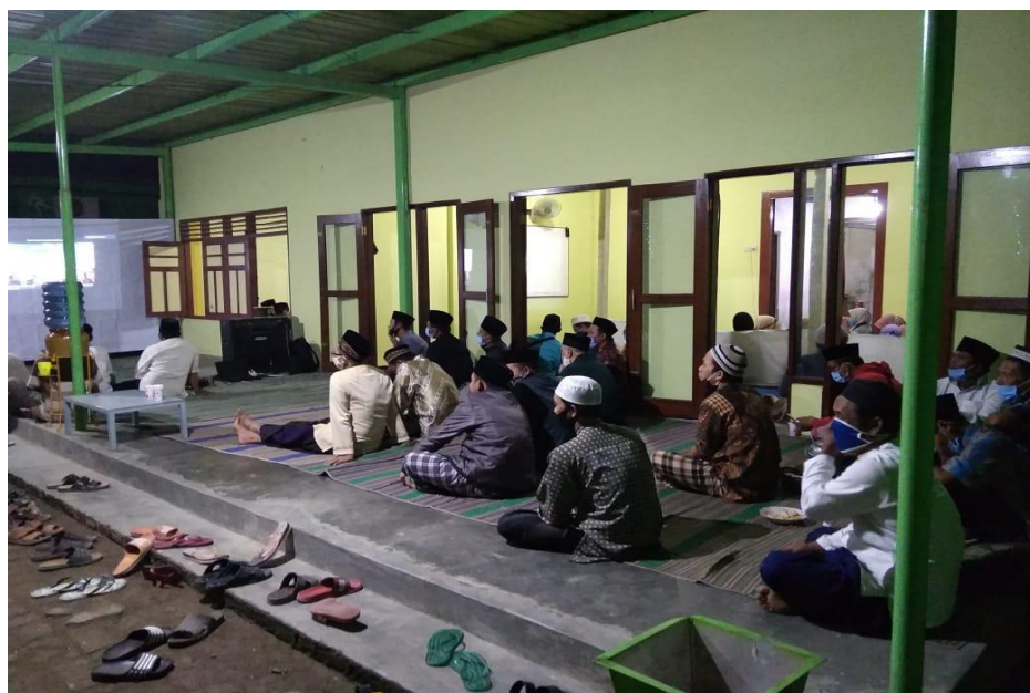
Gambar 1 Kegiatan di Rumah Belajar Serambi

Pemateri memberikan paparan lebih dalam tentang Non-Muslim. Bahwa tidak semua Non-Muslim (ahli kitab/Yahudi, Nasrani) mendapat kecaman dari Al-Qur'an. Memang terdapat kecaman terhadap mereka, namun kecaman tersebut disebabkan karena perbuatan mereka sendiri yang terus menebar permusuhan kepada kaum muslimin pada era Rasulullah. Kecaman ditujukan kepada perilaku pemeluknya, bukan kepada entitas agama. Hal ini terbukti bahwa Al-Qur'an sangat proporsional dan obyektif dalam melakukan penilaian, tidak sedikit dari kaum ahli kitab yang justru mendapat pujian dari Al-Qur'an. Seperti misalnya dalam surat al-Maidah ayat 82 yang artinya: dan sesungguhnya kamu dapati yang paling dekat persahabatannya dengan orang-orang yang beriman adalah mereka yang berkata: sesungguhnya kami ini orang Nasrani ".