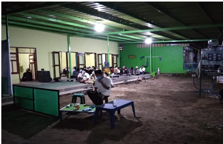
Gambar 3 Suasana Pengabdian pada tahap III

Pemateri mengawali penyajian dengan mempertegas definisi istilah dari moderasi agama. Yaitu bahwa, moderasi beragama adalah cara beragama jalan tengah. Sehingga, jika moderasi beragama sudah difahami dan diahayati oleh seseorang, maka dia tidak akan menjadi ekstrim dan berlebih-lebihan dalam menjalankan agama. Kemudian orang yang mempraktekkan moderasi beragama disebut sebagai moderat.