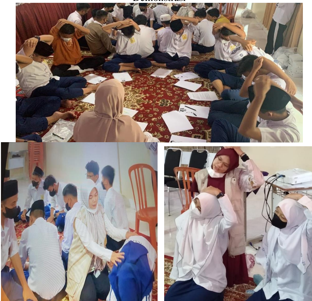
Gambar 2. Demonstrasi

Mengembangkan Kemandirian Siswa Berkebutuhan Khusus melalui Pelatihan Membuat Puding Bunga Telang