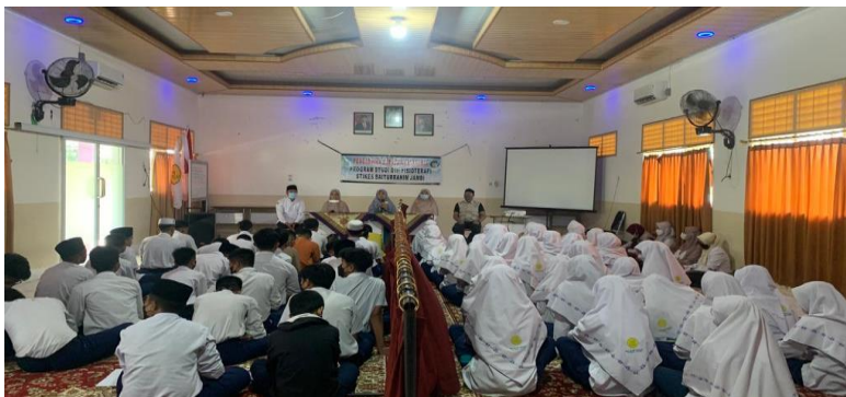
Gambar 1. Memberikan Materi

Pelaksanaan kegiatan PkM pada siswa SMP-IT Nurul Ilmi Kota Jambi kelas 8 berjumlah 24 siswa/siswi dilakukan secara tatap muka yang bertempat di aula. Materi yang disampaikan yaitu mengenai macam macam kelainan postur, cara menggunakan tas yang baik, posisi duduk yang benar dan cara latihan latihan core stability . Bentuk penyampain materi menggunakan media power point. Sebelum memulai penyampain materi, peserta diinstrusikan untuk mengisi kuis pre test yang berisikan 5 pertanyaan dari materi yang akan diberikan. Setelah itu dilakukan penyampain materi edukasi kelainaan postur, posisi duduk, dan cara menggunakan tas yang baik menggunakan media wayang selama 1 jam yang diikuti dengan sesi tanya jawab dan mempraktekkan latihan core stability .