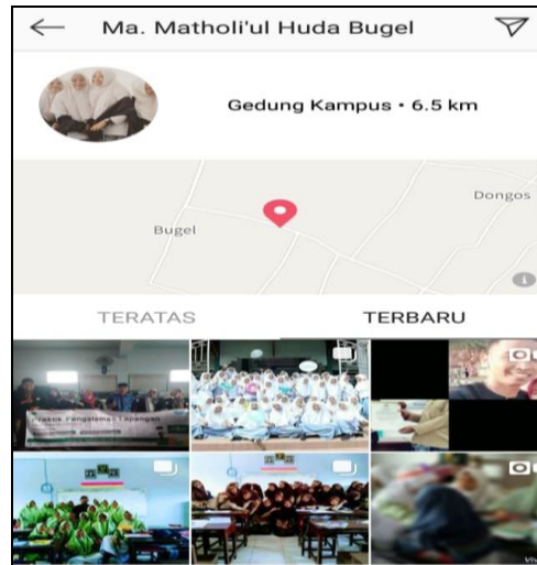
Figure 3. instagram of Madrasah Aliyah Matholiul Huda Jepara

promosinya. Promosi via instagram dilakukan dengan cara menampilkan events atau peristiwa yang berkenaan dengan kesiswaan dan kegiatan madrasah.