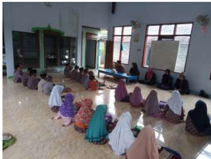
Gambar 3. Proses Pembelajaran di TPA Nurul Ulum

Aksi yang dilaksanakan mengacu pada penemuan masalah yang ada di TPA Nurul Ulum yaitu pembelajaran membaca Al Qur'an terpadu yang meliputi pembelajaran Tajwid, hafalan dan pemaknaan pada QS Al A'raf:56. Pemilihan surat bertujuan untuk menanamkan nilai-nilai kesadaran lingkungan yang termuat dalam Al-Quran pada para santri.