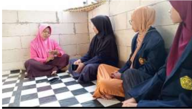
Gambar 1. Wawancara dengan Ustadzah TPA Nurul Ulum

Pelaksanaan kegiatan ini dilakukan secara langsung di TPA Nurul Ulum desa Krandegan Kecamatan Ngrambe. Kegiatan awal dilakukan dengan melakukan pengumpulan data awal di TPA dengan mewawancarai salah satu pengurus TPA.