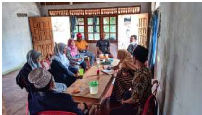
Gambar 2. Keikutsertaan pengabdian dalam kegiatan desa

Selanjutnya pendekatan ke masyarakat melalui keikutsertaan dalam kegiatan desa supaya lebih akrab dan diterima oleh masyarakat.