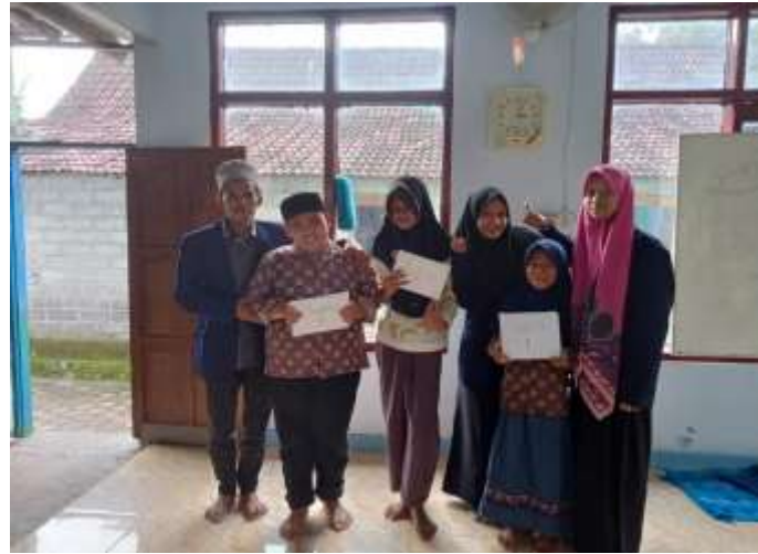
Gambar 4. Pemberian hadiah sesudah evaluasi hasil pembelajaran