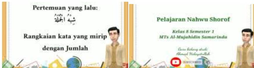
صورة الصفحة الأولى من المادة

ب. بعد الفتح والإدراك، يعطي المعلم المادة المراد دراستها من خلال مشاركة رابط الفيديو في مجموعة الوتساب. ها هي الباحثة تقدم مثالا لمادة النحو حول المواضيع الفصل الثامن الفصل الأول حول توزيع الملفات التي يتم تسليمها باستخدام الوسائط المتعددة المستندة إلى اليوتيوب: 19 ما يلي هو نتيجة التوثيق من أحد مقاطع الفيديو التعليمية للنحو: