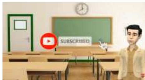
صورة المقطع الأخير من وسيلة اليوتيوب