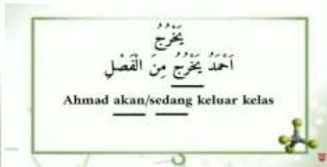
صورة شرح الأمثلة من الفعل المضارع