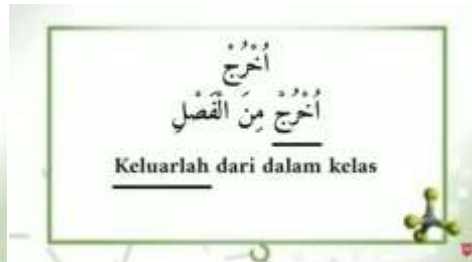
صورة خلاصة المادة