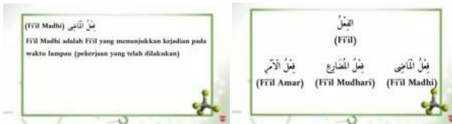
صورة تعريف الفعل الماضي