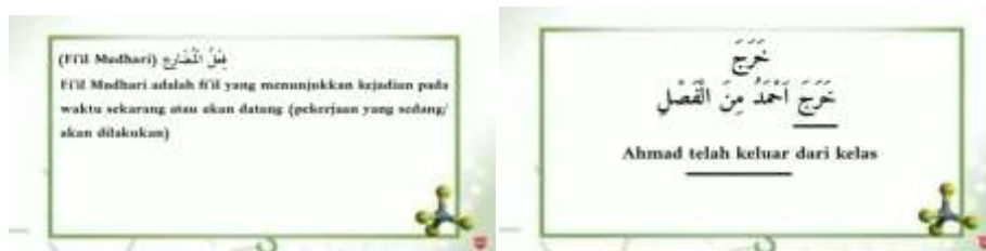
صورة تعريف الفعل المضارع