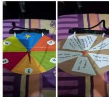
Gambar 2. Media roda berputar dalam pengambilan nilai kelompok pada siklus 1

lembar kerja siswa berupa 20 soal pilihan ganda yang harus dikerjakan, sedangkan untuk penilaian kelompok diambil dari kecepatan dan ketepatan siswa perwakilan kelompoknya dalam menjawab soal dari media roda berputar yang telah disediakan oleh penulis. Untuk nilai kelompok siswa dimasukkan menjadi nilai tambahan bagi individunya.