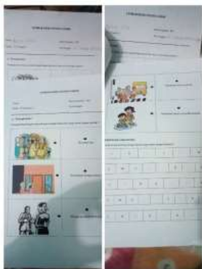
Gambar 3. Bentuk penilaian kelompok siklus 2

Untuk mengukur peningkatan hasil belajar siswa pada siklus kedua ini penulis melihat dari penilaian individu melalui lembar kerja peserta didik dan menggunakan website wordwall dengan fitur “ wordsearch ”. Adapun penyampaian materi masih menggunakan powerpoint dan proyektor serta menayangkan video berkaitan dengan “senang menolong orang lain dan ciri munafik”. Berikut ada bentuk penilaian serta kategori penilaiannya.