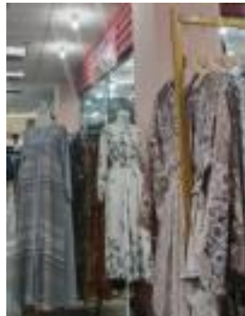
Gambar 2.6 Pesaing Pakaian Muslimah Toko Alfabe Clothing

Berdasarkan hasil dari data Toko Alfabe Clothing, pertimbangan pengusaha ini terhadap pesaing, disebabkan banyaknya para pesaing yang ada pada industri pakaian yang mempunyai harga kompetitif, jadi tidak kaget jika pengusaha Alfabe Clothing di Surabaya memandang penting soal jumlah pesaing yang ada di dekat toko ini. 12