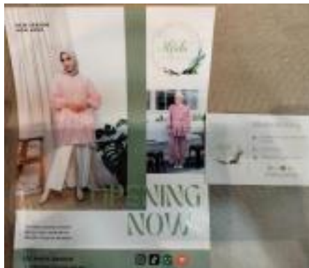
Gambar 2.1 Brosur dan Kartu Nama Alfabe Clothing

Dalam melaksanakan analisis internal pada aspek pemasaran, kebanyakan sebagian perusahaan bisnis memakai konsep bauran pemasaran ( marketing mix ) pemasaran. Bauran Pemasaran merupakan kombinasi dari empat (4) variable yang menjadi inti dari sistem pemasaran organisasi perusahaan di Alfabe Clothing yaitu: Produk (Product) pakaian muslimah, Harga (Price) Rp. 45.000 sampai Rp, 295.000, Tempat (Place) Mall ITC Surabaya, Promosi (Promotion) secara offline membagikan brosur dan kartu nama.