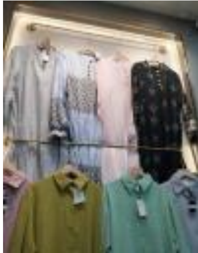
Gambar 2.4 Contoh Produk Dari Pemasok Tanah Abang

yang benar, maka kualitas barang bahan yang dipilih bagus akan menghasilkan barang yang baik. Toko Alfabe Clothing ini melakukan pembelian atau (grosiran) di pasar Tanah Abang Jakarta.