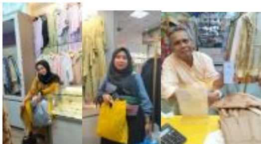
Gambar 2.5 Konsumen Alfabe Clothing

Berdasarkan hasil dari pengolahan data dari Toko Alfabe Clothing, pertimbangan pada pembeli, nyatanya perilaku pembeli yang dianggap paling tinggi pertimbangannya. Dengan memahami perilaku pembeli, contoh produk apa saja yang biasanya dibeli oleh para konsumen, kapan saat mereka membeli serta dimana mereka membeli, jadi Toko Alfabe Clothing mengambil keputusan untuk membuat barang yang sesuai dengan kemauan keinginan serta mengetahui lebih jauh dimana mereka memasarkan produk untuk konsumennya. Jadi, biasanya pengusaha Alfabe Clothing memahami perilaku pembeli melalui pesanan produk, serta dimana konsumen menjelaskan ciri-ciri pakaian muslimah mana yang ingin dipesan secara online maupun offline .