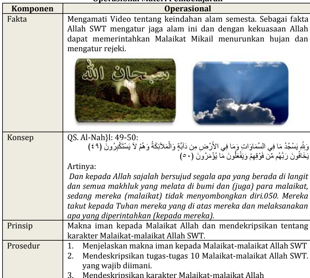
Tabel 2 Operasional Materi Pembelajaran

Terkait intruksi Permendikbud No. 65 tahun 2013 tentang Standar Proses Pendidikan Dasar dan Menengah yang memuat fakta, konsep, prinsip, dan prosedur tidak semua jenjang sekolah harus memuat empat komponen tersebut. Seperti pada jenjang sekolah menengah yang hanya memuat tiga komponen, yakni fakta, konsep, prinsip. Lebih jelasnya dideskripsikan pada Tabel 3.