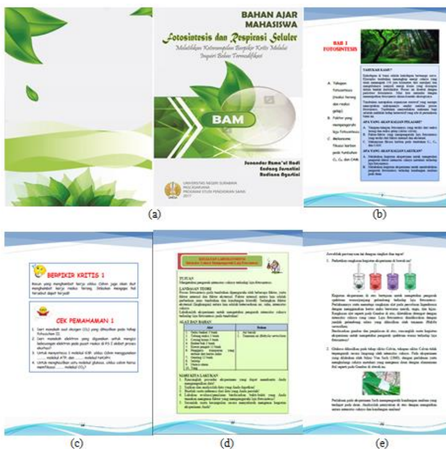
Gambar 1. Isi Buku Ajar Mahasiswa. (a) Cover, (b) Permasalahan, (c) Latihan soal keterampilan berpikir kritis dan pemahaman konsep, (d) Kegiatan laboratorium, (e) Uji Kompetensi.

Bahan ajar yang disusun dalam penelitian ini dilengkapi dengan konten/isi yang bertujuan untuk meningkatkan rasa ingin tahu mahasiswa terhadap materi yang disajikan. Keingintahuan mahasiswa dapat mewujudkan suasana belajar yang berpusat pada mahasiswa dan dapat melatih keterampilan berpikir kritis serta pemahaman konsep mahasiswa. Uno (2008), menyatakan bahwa dalam belajar peserta didik tidak hanya berinteraksi dengan guru sebagai sumber belajar, melainkan berinteraksi dengan keseluruhan sumber belajar yang ada termasuk dengan bahan ajar mahasiswa yang dikembangkan pada penelitian ini. Berikut disajikan materi, kegiatan laboratorium dan latihan soal yang terdapat pada bahan ajar mahasiswa yang dapat dilihat pada Gambar 1.