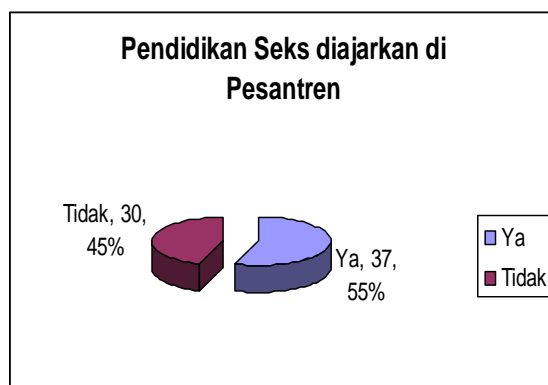
Gambar 2: Pendapat Santri tentang Pelaksanaan Pendidikan Seks di Pesantren

Istilah pendidikan seks yang tidak populer di pesantren Bani Syafi'i menyebabkan hampir sebagian santri, yaitu 45% menganggap bahwasannya pendidikan seks tidak diajarkan (Figure 2) dan menganggap seks sebagai sesuatu yang tidak penting (52%) dan tidak pantas (55%) untuk diajarkan di lembaga pendidikan Islam seperti pesantren. Padahal berdasarkan data di atas mereka sudah mengikuti pendidikan seks dan memahami dengan baik persoalan-persoalan yang berkaitan dengan masalah pendidikan seks.