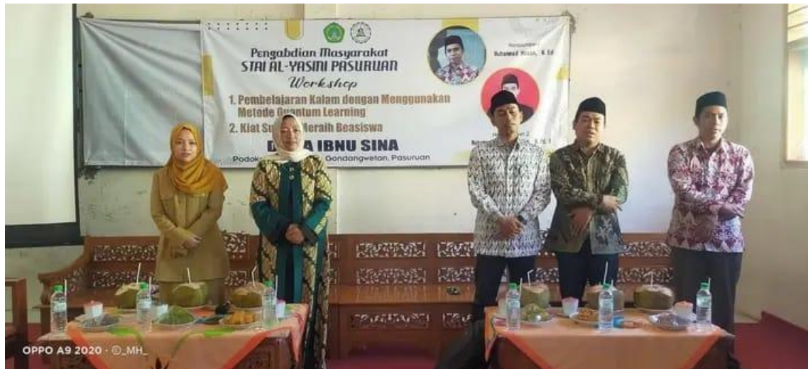
Para Pemateri bersama Kepala MA Ibnu Sina dan Majelis Pengasuh Ma'had