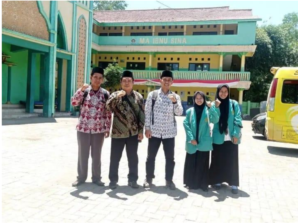
Pemateri dan Mahasiswi PPL di Depan Bangunan MA Ibnu Sina