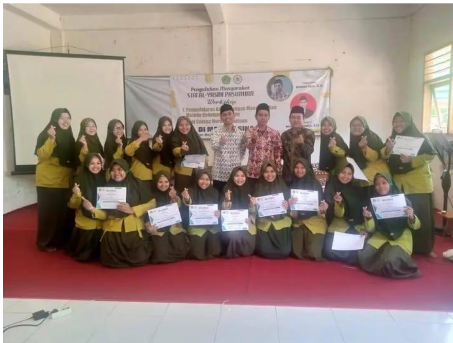
Foto Bersama Para Siswi MA Ibnu Sina