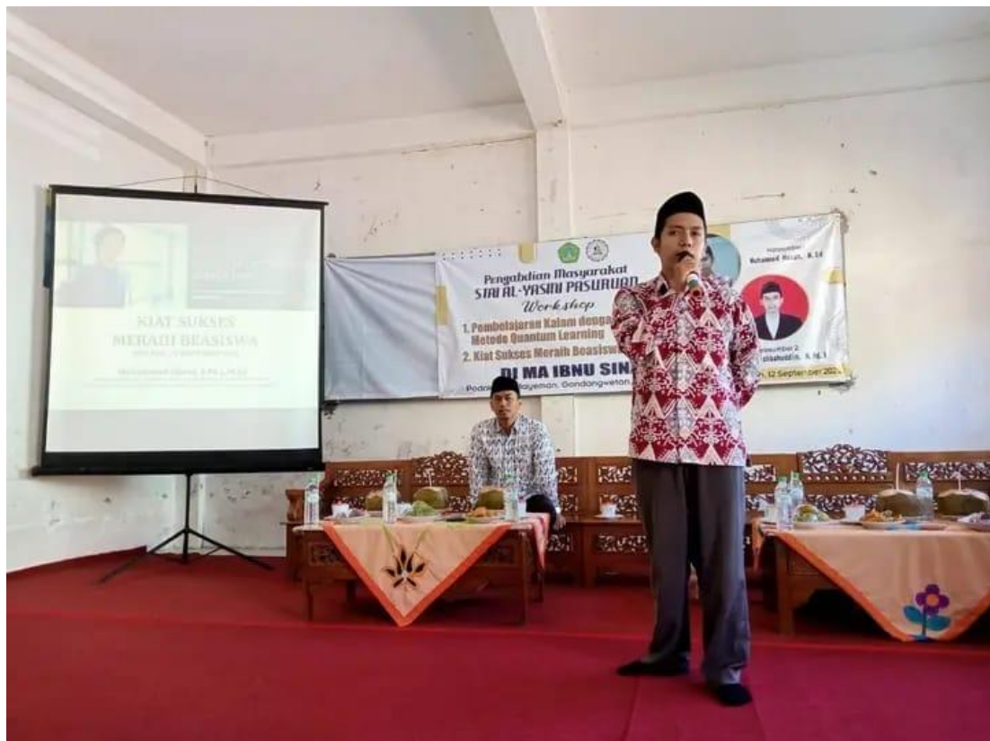
Pemateri Menyampaikan Materi Workshop