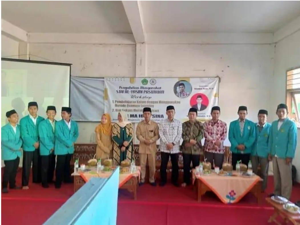
Para Pemateri Bersama Kepala MA, Majelis Pengasuh Ma'had, dan Mahasiswa PPL