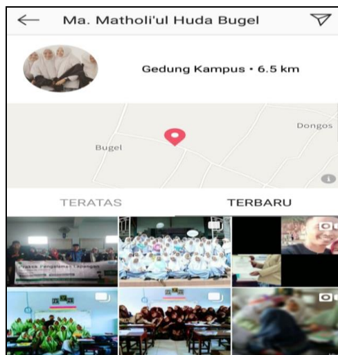
Figure 3. instagram of Madrasah Aliyah Matholiul Huda Jepara

promosinya. Promosi via instagram dilakukan dengan cara menampilkan events atau peristiwa yang berkenaan dengan kesiswaan dan kegiatan madrasah.