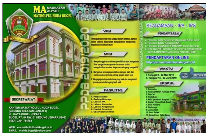
Figure 4. brochure of Madrasah Aliyah Matholiul Huda Jepara