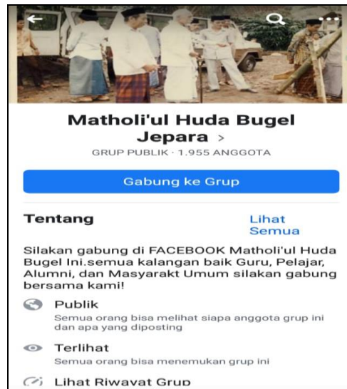
Figure 2. facebook of Madrasah Aliyah Matholiul Huda Jepara

Madrasah Aliyah Matholiul Huda Jepara memanfaatkan media sosial facebook untuk membuat jejaring yang melibatkan semua kalangan yang terkait dengan melibatkan baik guru, pelajar, alumni dan masyarakat umum. Media ini digunakan dengan alasan bahwa hampir setiap orang dengan mudah mengakses facebook. Segala macam informasi dapat dengan mudah disebar dan diakses melalui facebook.